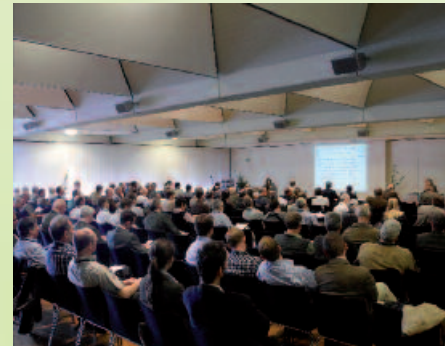
Seminarteilnehmer in Aachen

unverzichtbare Kommunikationsplattform über Länder- und Verwaltungsgrenzen hinweg.