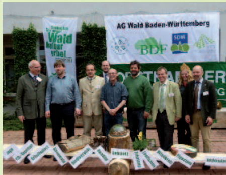
Teilnehmer an der Abschlussveranstaltung der politischen Waldfahrt in Baiersbronn, Bild: G. Jehle

Die politische Bahnfahrt wird von den Organisatoren als großer Erfolg gewertet! Wo sonst sind wir als Forstleute schon mit 12 Abgeordneten gleichzeitig ins Gespräch gekommen? Wo sonst wurden wir als forstliche Verbände in einer gemeinsamen Zielsetzung auch gemeinsam wahrgenommen? Wo sonst gab es schon mal eine rollende Waldbahn?