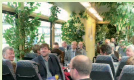
Die „Waldbahn“ von innen

der Landespresse waren eingeladen. Der Wald und die Fülle seiner Aufgaben sowie der darin Beschäftigten sollte bei der Fahrt ins Gespräch und ins Bewusstsein politischer Entscheidungsträger gebracht werden.