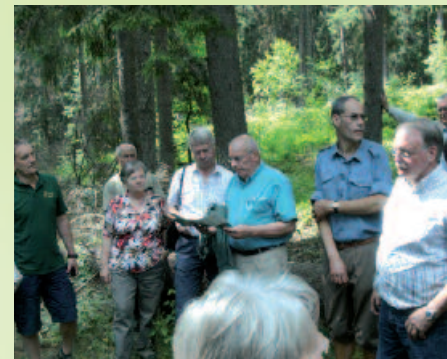
Exkursionsteilnehmer am Waldbild in der Rominter Heide