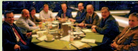
Vertreter der AG Wald im Austausch mit dem Vorstand der Forstkammer

In Zeiten immer knapper werdender Freiräume für ehrenamtliche Tätigkeit und der Notwendigkeit einer starken forstlichen Lobby bestätigt sich einmal mehr die Notwendigkeit und die Effektivität der AG Wald. Jeder Verband für sich allein hätte im politischen Umbruchsjahr 2011 nicht diese Präsenz zeigen können.