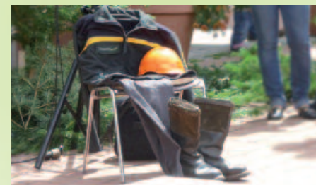
Der wegrationalisierte Förster

Binahe übersehen hätte der Zugführer den Haltepunkt in Klosterreichenbach. Dort stand niemand! Einzig die Uniform eines wegrationalisierten Försters hing über einem Stuhl. Symbol für den andauernden personellen Kahlschlag im Forst im Waldland Baden-Württemberg.