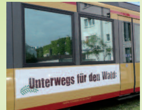
KVV Bahn in Karlsruhe

Als Werbeträger für den Wald und die forstlichen Verbände dient ein Stadtbahnwagen des Karlsruher Verkehrsverbundes (KVV): Dieser Stadtbahnwagen wurde auf ganzer Länge mit Werbeslogans und dem Logo zum Internationalen Jahr der Wälder sowie den Logos der Beteiligten (neben AG Wald und Forstkammer auch der KVV, die Gemeinde Baiersbronn und der Naturpark Schwarzwald Mitte-Nord) beklebt: