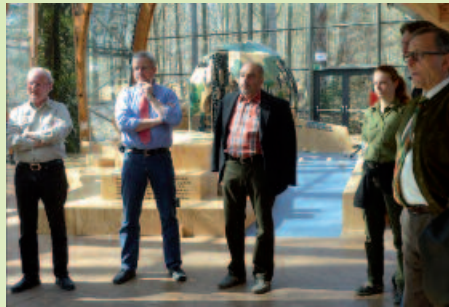
Beiratssitzung des Forstvereins bei der Besichtigung der neuen Ausstellung im HdW, Bild: I. Hormel

Falls sie Interesse haben, zukünftig als Vorstands- oder Beiratsmitglied aktiv in unserem Verein mitzuarbeiten, so setzen Sie sich bitte mit dem Vorstand oder der Geschäftsstelle in Verbindung.